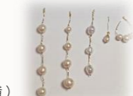
パールピアス作り

場 所 大阪狭山市役所南館1階会議室(きらっとぴあ横) 時 間 毎月異なります 対 象 テーマに関心のある方 定 員 8名程度(先着順) 参加費 材料費実費徴収