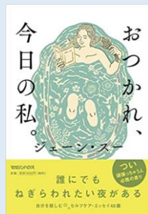
おつかれ、今日の私 ジェーン・スー 著 マガジンハウス

「ひととちがうことをこせいとかがいっていいのよ。みんないろいろちがうってとてもすてきよね！」この文章に作者の思いがギュッと詰まっていると感心しました。多くの方にぜひ、手に取ってほしいです。