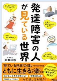
発達障害の人が見ている世界 岩瀬 利郎 著 アスコム

1万人以上の発達障害の人たちと向き合ってきた精神科医が、発達障害の特性を持つ人、とりわけADHDとASDの人が「見ている世界」を紹介する一冊