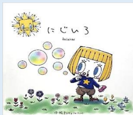
にじいろ ケイティー 著 三恵社

なぜ、お母さんと子どもの設定なのか？作者に質問したところ、アメリカでは4歳になると異性の親子は一緒にお風呂に入れないことから、海外でも通用する本をとの思いで描かれています。ジェンダーには様々な視点がありますが、この絵本では、いろんな角度からジェンダー視点が盛り込まれているので、読み手によって感じ方が違う一冊となっています。